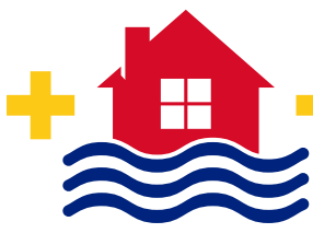
INONDATION DE LA RIVIÈRE AU PRINTEMPS